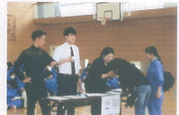
引き渡し訓練の様子

また、地震だけでなく、日頃の通学等で危険だと思われる個所についても点検し、異常があれば学校へ御連絡ください。