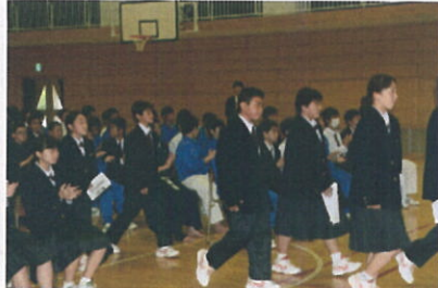
堂々と新入生が入場

入学式からちょうど1週間目の4月12日(木)、生徒会主催の新入生歓迎会が行われました。2、3年生はICT機器を活用してわかりやすく生徒会活動を説明したり、部活動紹介では工夫を凝らして部の様子を紹介したりと、先輩として歓迎の気持ちを込め、わかりやすく、また、楽しめる会を作り上げました。1年生はこの歓迎会を受け、生徒会の一員としての活動が始まりました。今後の活躍に期待します。