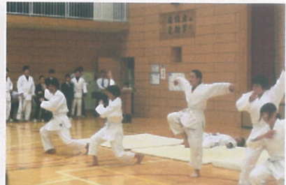
好評だった柔道部の紹介